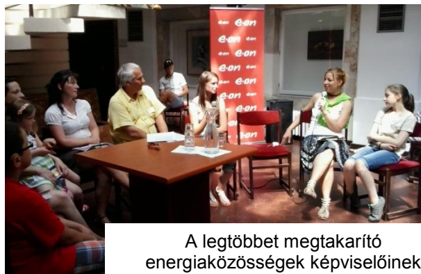
A legtöbbet megtakarító energiaközösségek képviselőinek kerekasztal beszélgetése

A legjobban szereplő és legtöbbet megtakarító közösségek a hétfői díjkiosztó rendezvényen beszámoltak eredményeikről, valamint értékes nyereményeket vehettek át, amelyek tovább segítenek nekik a klímabarát, zöld életmód megvalósításában. A győztes egyházasfalui Rezsizselidítők közösség tagjai 54,9% energiát takarítottak meg korábbi referencia fogyasztásukhoz képest, a 2. helyezett KaméEON csapat 27,6%-ot, a 3. helyezett győri Villanyászok pedig 23,2%-ot. A versenyben résztvevő 160 háztartás átlagos megtakarítása 9 % volt, amely összesen több mint 120.000 kWh megtakarítást jelent.