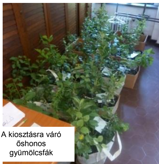
A kiosztásra váró őshonos gyümölcsfák