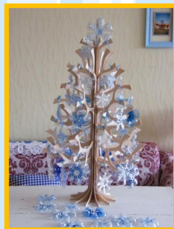
Díszek PET-palackból: http://artesan.blog.hu

Ajándékozunk megtakarítást: http://energiaklub.hu/hir/ajandekozzon-megtakaritast Zöld és pénztárcakímélő: http://www.tudatosvasarlo.hu/cikk/tippek-zold-es-penztaarcakimelo-karacsonyhoz