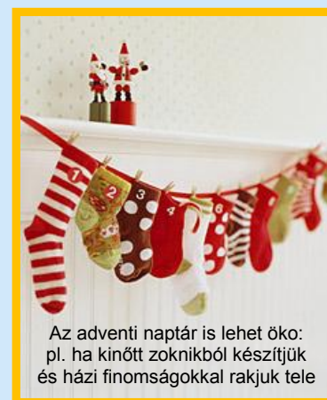
Az adventi naptár is lehet öko: pl. ha kinőtt zoknikból készíjtjük és házi finomságokkal rakjuk tele